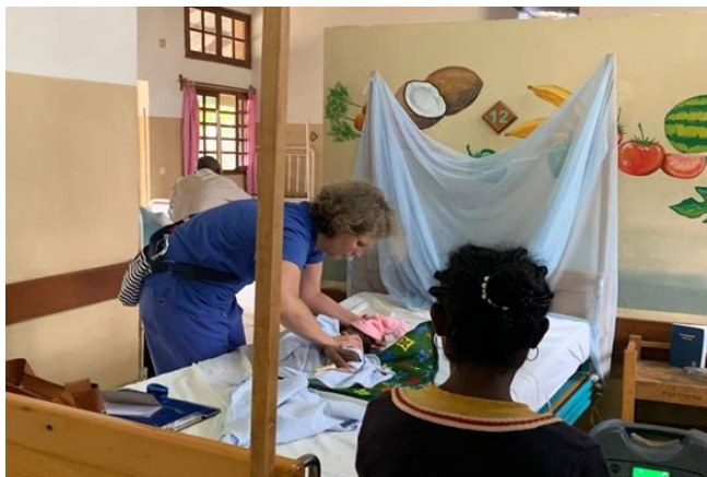
Behandlung eines kleinen Kindes

Was haben wir erlebt in der Ferne? Vieles! Einiges war nervig – die juckenden Flohstiche, der Verzicht auf Nudeln, Milchprodukte und laue Sommerabende.